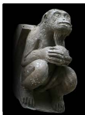
Saint Jouin de Marnes (Deux Sèvres)