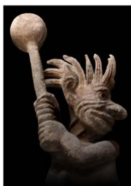
Sainte Foix de Conques (Aveyron)