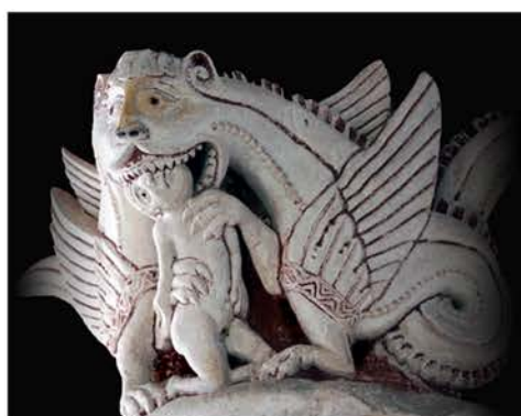
Collégiale Saint Pierre à Chauvigny (Vienne)